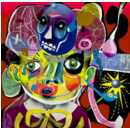
Ancestor #8 , 2011, acrylic on board, 30x30 cm