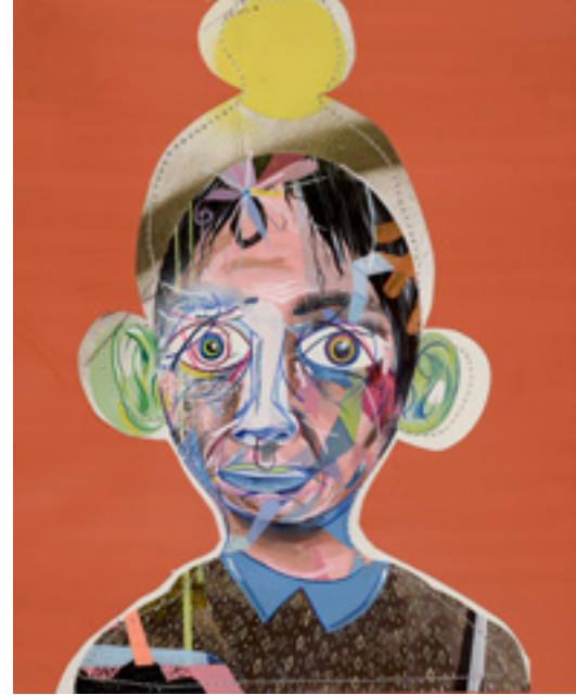
Hand Me Down , 2013, mixed media on paper, 84x58 cm