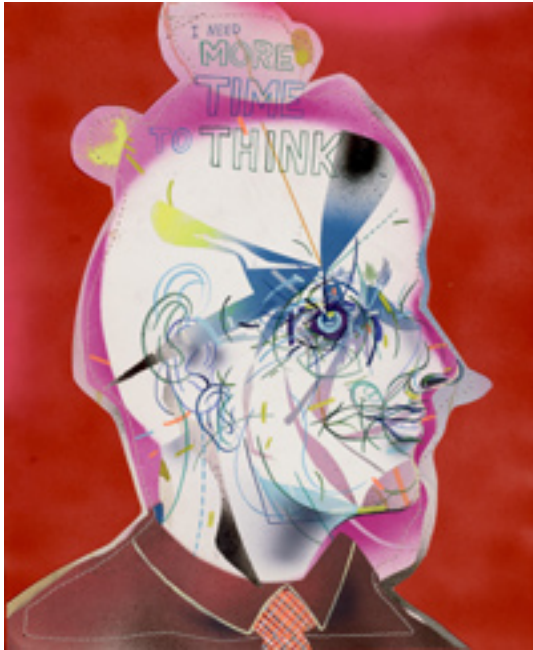
Dickering Haggler Hopper B, 2013, mixed media on paper, 43x35 cm Heading Back Home, 2013, mixed media on wood panel, 25x20 cm