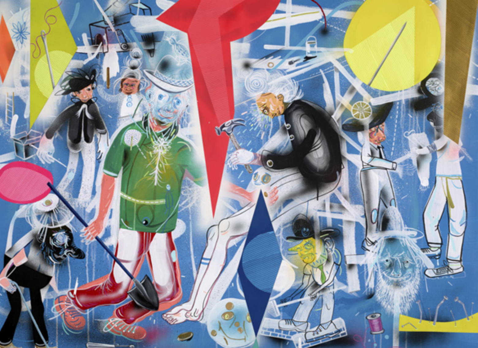
Volunteer Tinkering , 2013, mixed media on paper, 91x130 cm