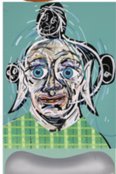
Orange Crutch , 2013, mixed media on wood panel, 200x39 cm and detail