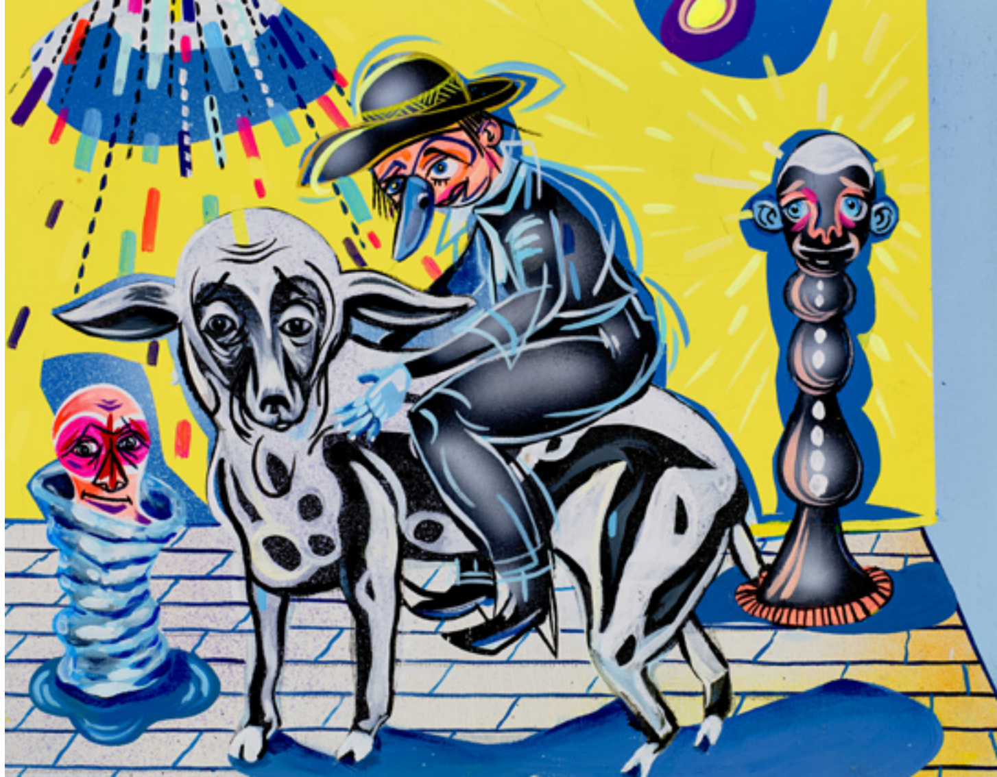
Cheapjack , 2013, mixed media on wood panel, 20x25 cm