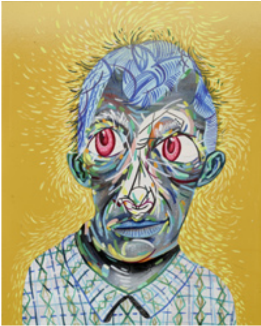
Lily-livered , 2013, mixed media on wood panel, 25x20 cm Hello Jack , 2013, mixed media on wood panel, 26x24 cm