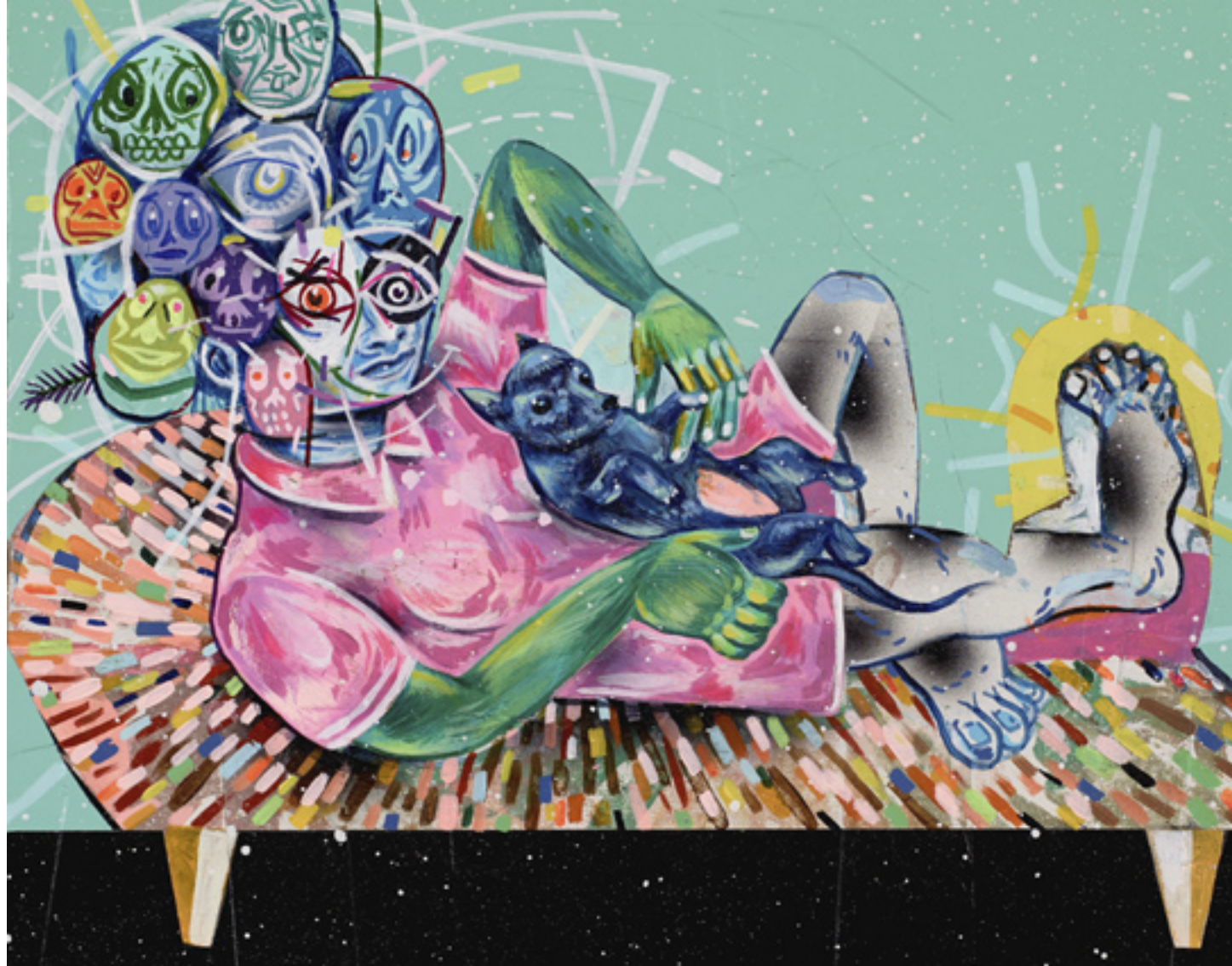
Relax It's All in Your Head , 2013, mixed media on wood panel, 20x25 cm