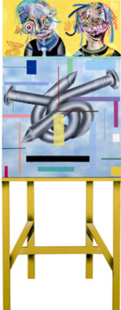
Wallop and Clobber, 2013, mixed media on wood panel, 157x60 cm Welcome Sun Thrifters, 2013, mixed media on paper, 130x91 cm