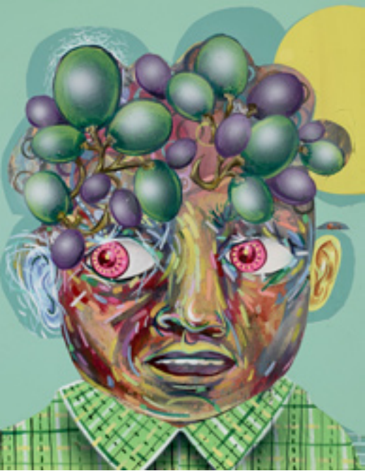
Your Ok , 2013, mixed media on wood panel, 28x22 cm Scrimper , 2013, mixed media on paper, 130x91 cm