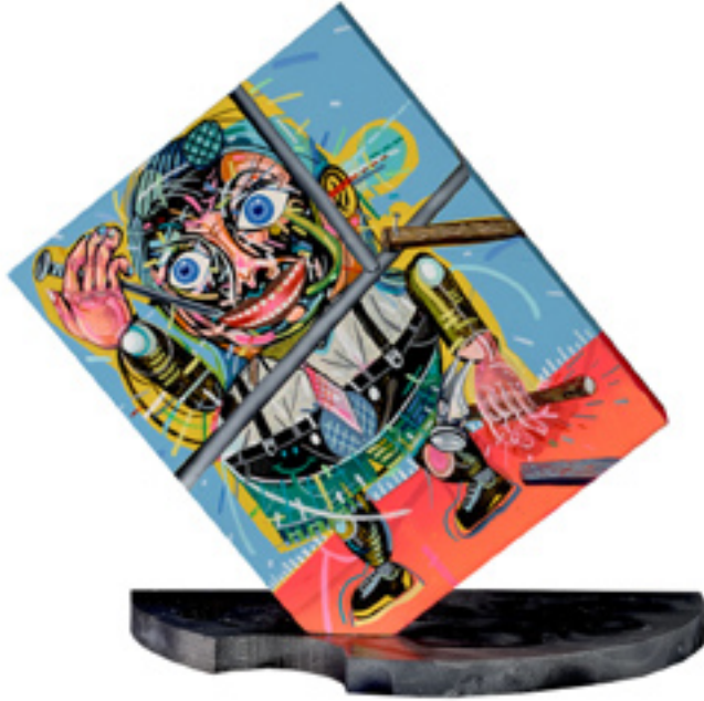
Over the Moon , 2013, mixed media on wood panel, 30x25x1.5 cm