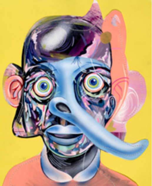
Dickering Haggler Hopper E, 2013, mixed media on paper, 43x35 cm Feeling Fairly Fiddler, 2013, mixed media on wood panel, 28x14,5 cm