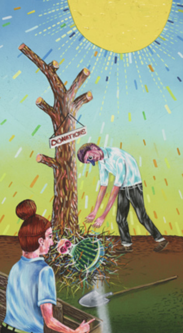
Leave It , 2013, mixed media on wood panel, 39x22 cm It's All Bright , 2013, mixed media on canvas, 76x76 cm