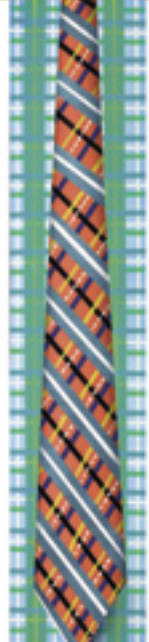
Greeter Hello , 2013, mixed media on panel, 137x44 cm and detail