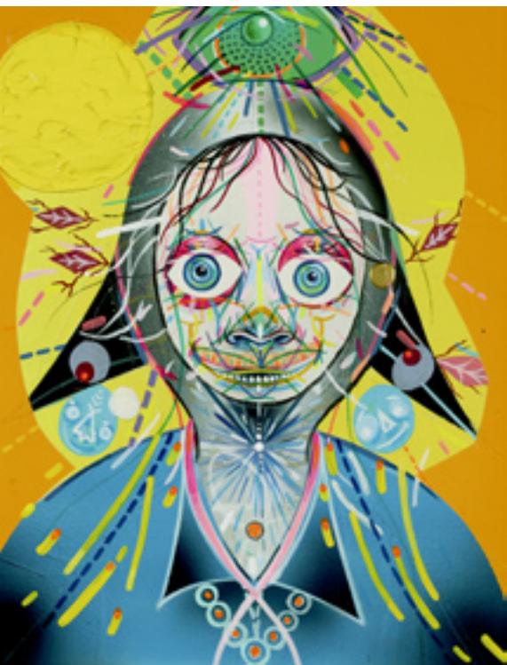
Odd Duck , 2013, mixed media on wood panel, 25x20 cm Mending Cooing Clusters , 2013, mixed media on paper, 130x91 cm