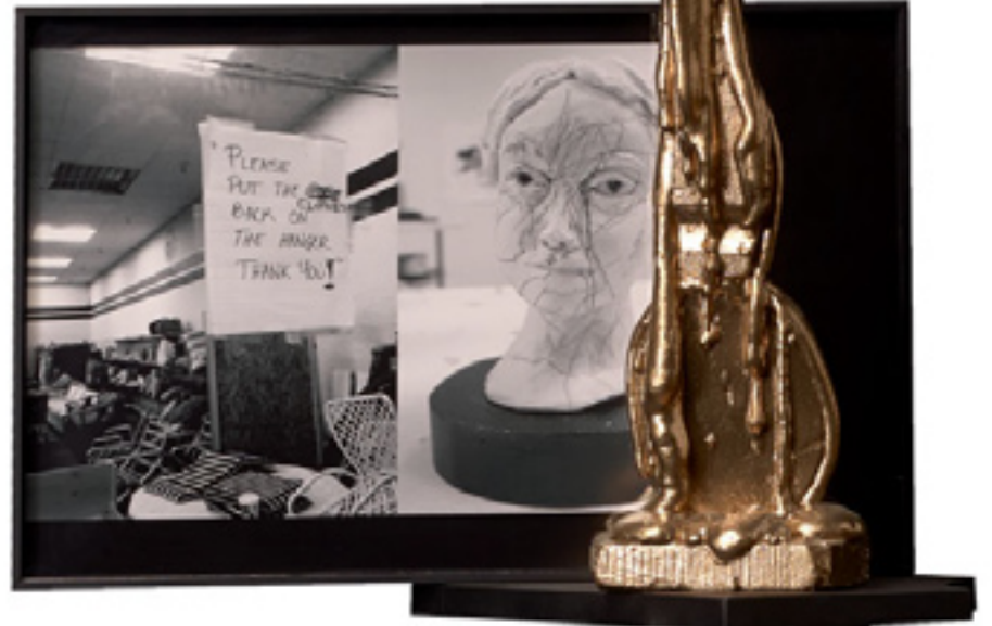
I Understand , 2013, mixed media, foam, photograph and wood, 183x40x40 cm and detail