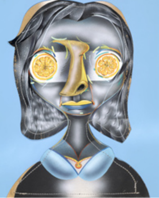
Dickering Huggle Hopper D , 2013, mixed media on paper, 43x35 cm Gleaming Crystal Gazer , 2013, mixed media on wood panel, 25x20 cm