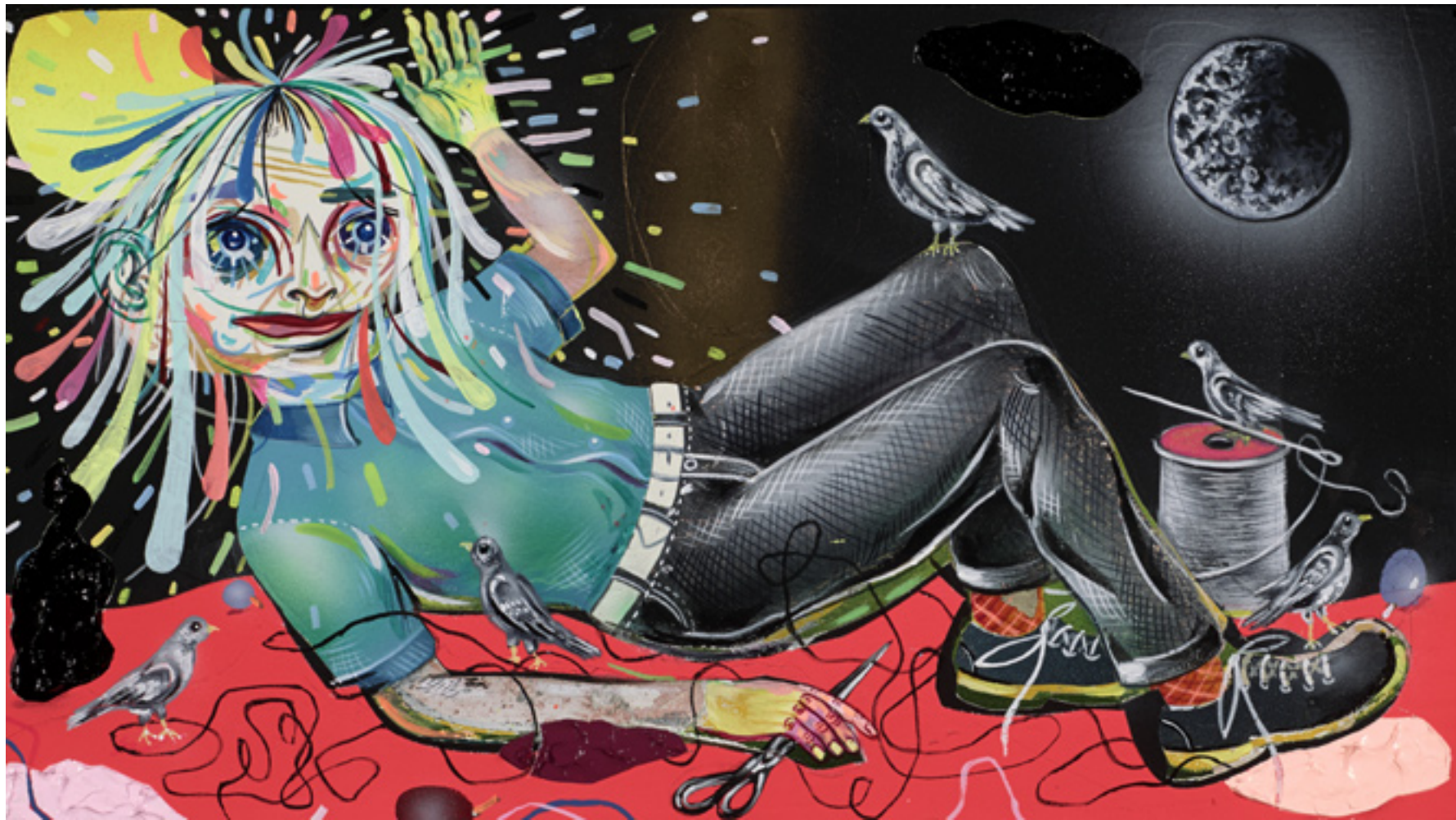
Waning Crescent Mood, 2013, mixed media on wood panel, 22x39 cm