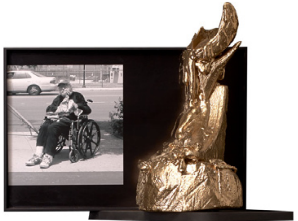
Can you Spare a Duck , 2013, mixed media, 183x40x40 cm and detail