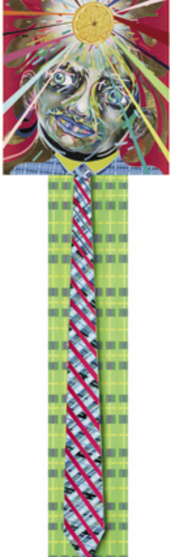
Greeter Goodbye , 2013, mixed media on panel, 114x34 cm and detail