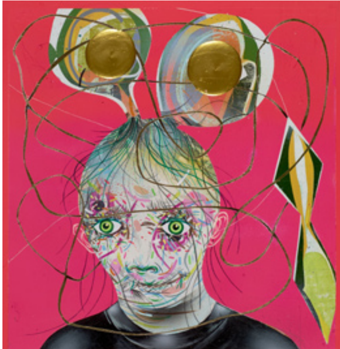
You See I'm Ok , 2013, mixed media on wood panel, 29x30 cm Time Will Only Tell , 2013, mixed media on canvas, 183x127 cm