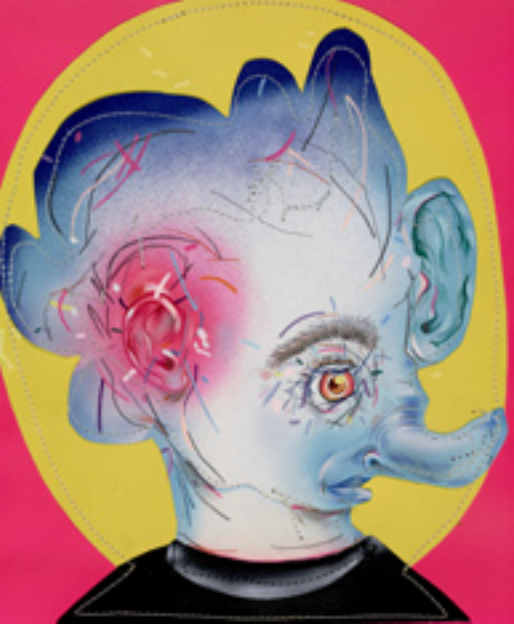
Dickering Haggler Hopper C , 2013, mixed media on paper, 43x35 cm All in Due Time , 2013, mixed media on canvas, 183x127 cm