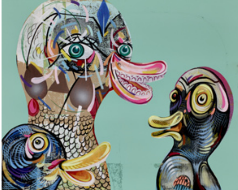
Quack, Cackle & Squawk, 2013, mixed media on wood panel, 20x25 cm

All'inizio c'è sempre un gioco, una complice condivisione di regole che conducono a una relazione speciale, il cui risultato è sempre superiore alla somma delle parti. I Surrealisti ne avevano adottato uno particolare, quello dei cadaveri eccellenti, detto anche cadavre exquis, un passatempo creativo che si può giocare con parole o immagini. Funziona così: uno crea la prima immagine e la passa al partecipante successivo, celandone, però, una parte. Quest'ultimo la arricchisce con nuove aggiunte, a sua volta celandola parzialmente, prima di passarla al giocatore seguente. Si può giocare in gruppo, ma bastano anche solo due persone. Alla fine del gioco, si ottiene un'immagine inaspettata, sorprendente, frutto di un processo insieme creativo e interpretativo, che amplifica l'apporto dei singoli, inglobandoli in una trama grafica collettiva.